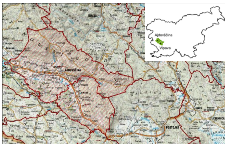
Slika 1: Geografska umeščenost območja LAS

Območje LAS Vipavska dolina zajema celotno območje Upravne enote Ajdovščina, občini Ajdovščina in Vipava, ki pokrivata Zgornjo Vipavsko dolino. Območje je del Severno Primorske (Goriške) razvojne regije, ki sodi v Zahodno kohezijsko regijo.